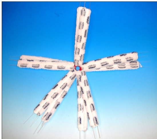
Mob - Einlage LRS mit Verstärkungsprofilen