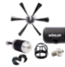
Wöhler SI 400 Smarte Inspektionskamera