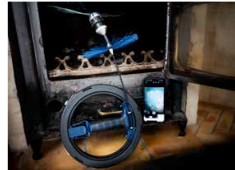
Wöhler SI 400 Smarte Inspektionskamera mit Kompakthassel Mini und Hochtemperatur-Leinstern, Bildanzeige auf dem Smartphone über die kostenlose App Wöhler Smart Inspection.