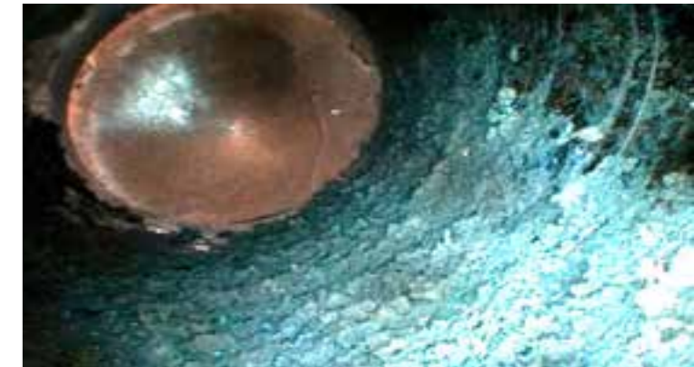
HD-Bild der Wöhler SI 400 Smarte Inspektionskamera.