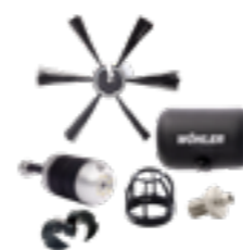
Wöhler SI 400 Caméra d'inspection connectée