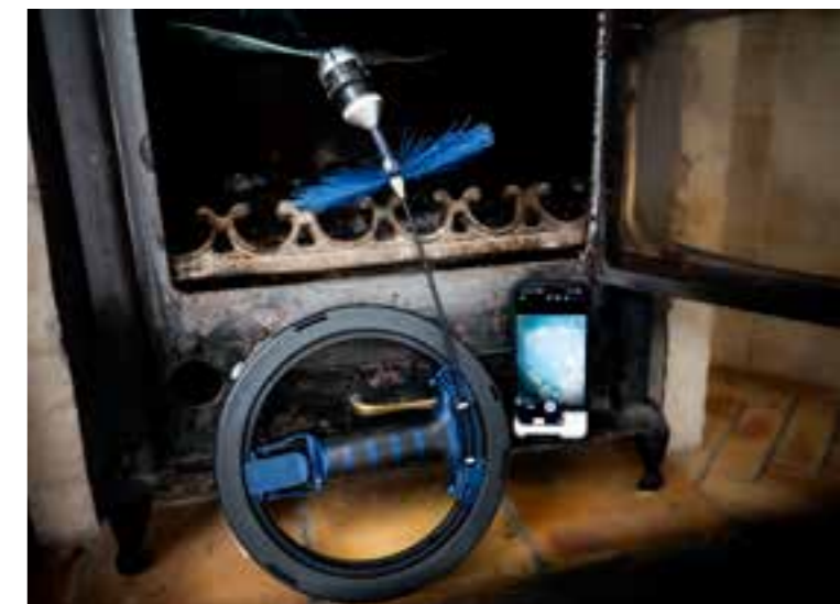
Caméra d'inspection connectée Wöhler SI 400 avec enrouleur Mini S et hérissin haute température, affichage des images sur le smartphone via l'application gratuite Wöhler Smart Inspection.