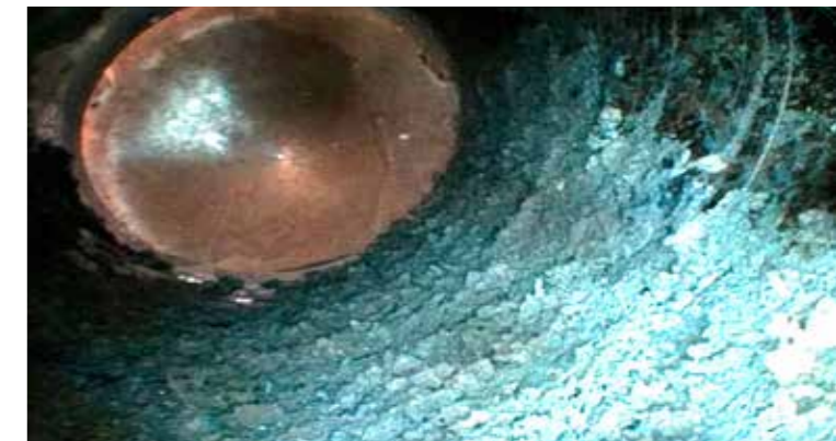
HD-Bild der Wöhler SI 400 Smarte Inspektionskamera.