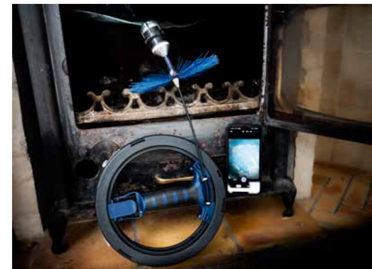
Wöhler SI 400 Smarte Inspektionskamera mit Kompakthaspel Mini und Hochtemperatur-Leinstern, Bildanzeige auf dem Smartphone über die kostenlose App Wöhler Smart Inspection.