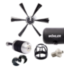
Wöhler SI 400 Smarte Inspektionskamera