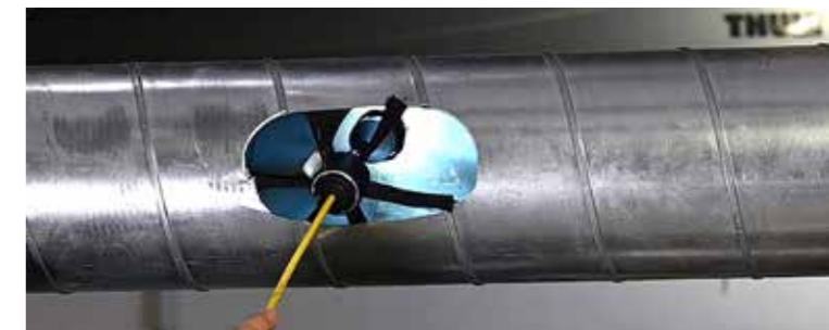
Inspektion einer Luftleitung mit der Wöhler SI 400 Smarte Inspektionskamera.