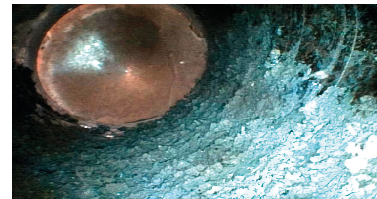
Image HD de la caméra d'inspection connectée Wöhler SI 400.