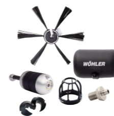
Wöhler SI 400 Caméra d'inspection connectée