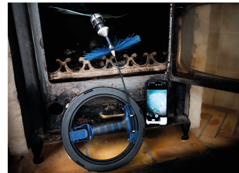
Caméra d'inspection connectée Wöhler SI 400 avec enrouleur Mini S et hérisson haute température, affichage des images sur le smartphone via l'application gratuite Wöhler Smart Inspection.